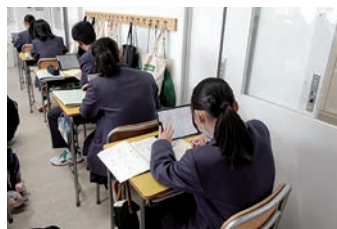
ICTを活用した数学の授業