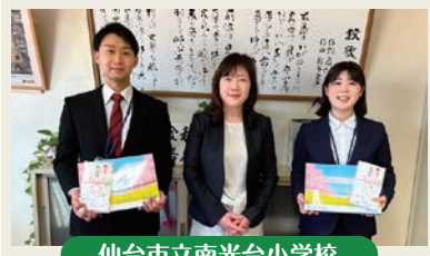
仙台市立南光台小学校

難関を突破し、今年も多くの新任の先生方が夢と希望を抱いて着任なさいました。改めてお祝いを申し上げます。弘済会宮城支部では、校長先生にも同席していただき、お祝いの品をお渡しいたしました。新任の先生方の今後のご活躍に期待しております。また、今後も弘済会として応援して参ります。