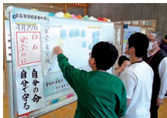
学校防災について学んでいます

白石市立白石南小学校・白石市立白石南中学校（通称：白石きぼう学園）は、東北初・全国3番目の市立小中一貫の不登校特例校として2023年4月に新設されました。学校のコンセプトは「学校らしくない学校」で、静かな環境の中で、児童生徒の個々の状況に応じた支援を行い、社会的に自立できる力を育てていく学校です。児童生徒一人一人が自分のペースで、楽しく学校生活を送っています。