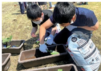
野菜の苗を植えています