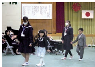
入学式で8・9年生とともに入場する1年生

大崎市立古川西小中学校は、大崎市立西古川小学校、志田小学校、高倉小学校、東大崎小学校、古川西中学校の5校が統合し、2023年4月に新設された大崎市初の義務教育学校です。教育目標「共に学び 高め合い 夢に向かって未来を拓く 児童生徒の育成」を目指し、1年生（小1）～9年生（中3）まで339人（6月27日現在）の児童生徒が、生き生きとした日々の学校生活を送っています。