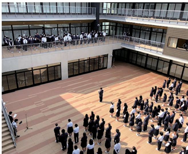
地区総体報告会と各種大会社行式

校訓として「自立貢献」を掲げ、自ら考え行動できる精神的強さと他者や社会に貢献しようとする生徒の育成を目指しています。