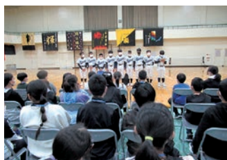
【対面式】での部活動紹介（5～9年生）