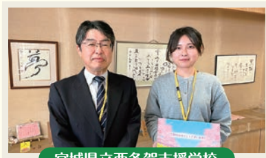
宮城県立西多賀支援学校