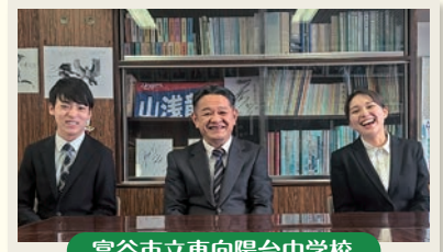
富谷市立東向陽台中学校