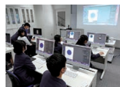
CGデザイン実習 (企画デザイン科)