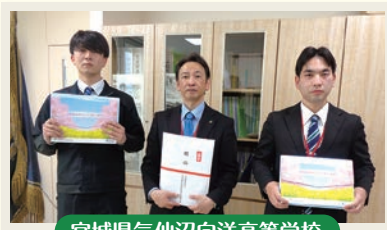
宮城県気仙沼向洋高等学校