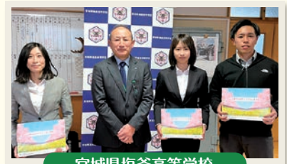
宮城県塩釜高等学校