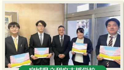
宮城県立利府支援学校