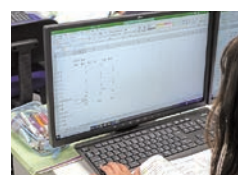
情報処理 (総合ビジネス科)