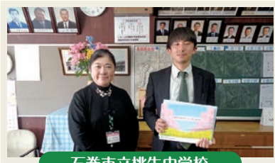
石巻市立桃生中学校