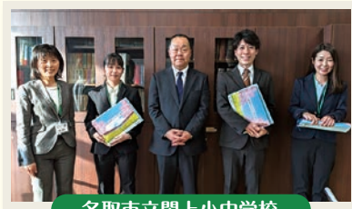
名取市立閑上小中学校