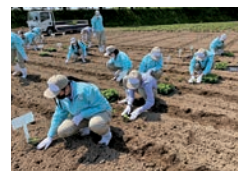
農業と環境 (農業科学科)