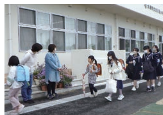
保護者参加の挨拶運動「おはようパード」