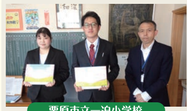
栗原市立一迫小学校