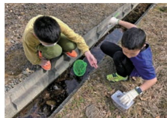
各自のペースで学びが深まります